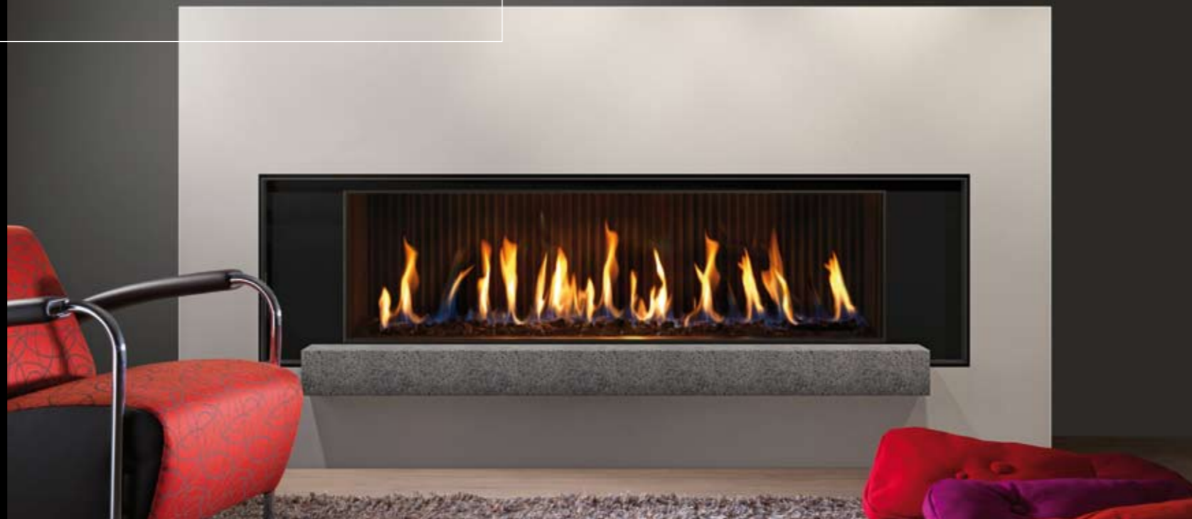
Voorzijde | Vue de face

De Fairo 160 ECO-line is een stijlvolle gashaard die met de meest moderne techniek is uitgerust. De Fairo 160 beschikt met de iMatch over een nieuw en exclusief besturingssysteem voor gashaarden, dat optioneel met een iPhone, iPad of Android kan worden aangestuurd. Zo kan de hoogte van het vlammen spel van de haard vanuit de luie zetel worden geregeld, en is er zelfs geen aparte afstandsbediening meer nodig.